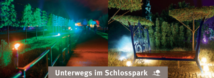
Unterwegs im Schlosspark